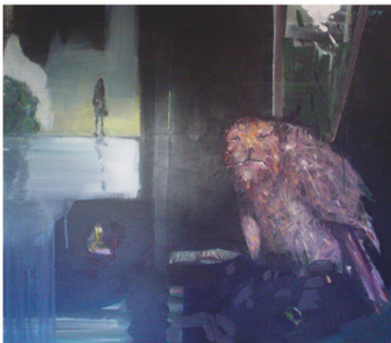
Gregor Lanz, 'Ohne Titel' 66x90 cm, Öl auf Leinwand, 2019 (Ausschnitt)

SCHLÖSSCHEN VORDER-BLEICHENBERG BIBERIST